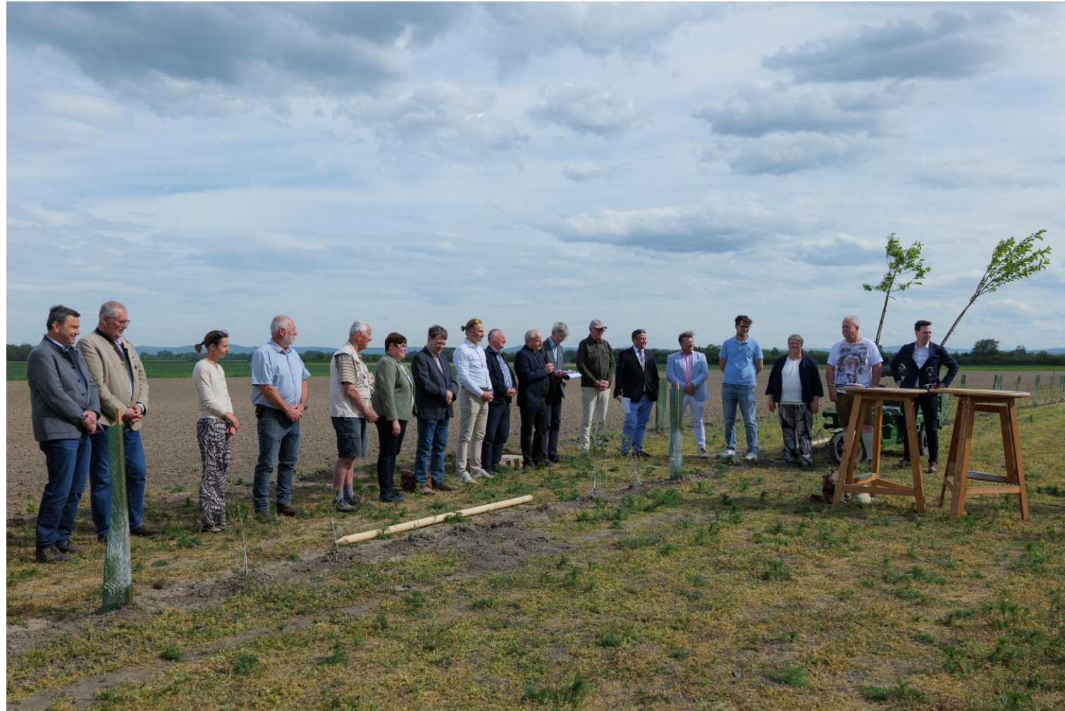
Vertreterinnen und Vertreter aus Politik, Kirche, Verwaltung, Landwirtschaft und den Partnerorganisationen fanden sich zur Segnung der Mehrnutzenhecke ein.