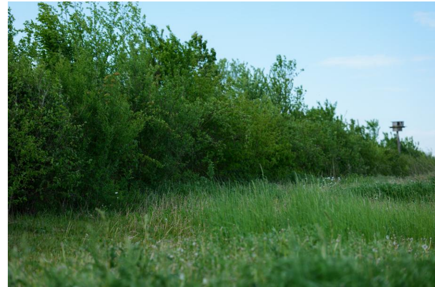
bestehende Mehrnutzenhecke Grand Farm