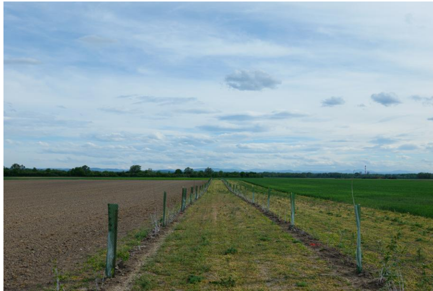
2026 gepflanzte Mehrnutzenhecke EU Horizon Projekt ARCADIA

Biotopverbund für Bodenschutz, Biodiversität und Klimaanpassung